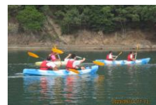
(昨年度の様子より)

『若狭研修』福井県小浜市阿納にて、漁村体験を行います。民宿に泊まり、漁村で働く人々の体験談をたくさん聞いて、今後の自身の進路選択に活かしていきます。